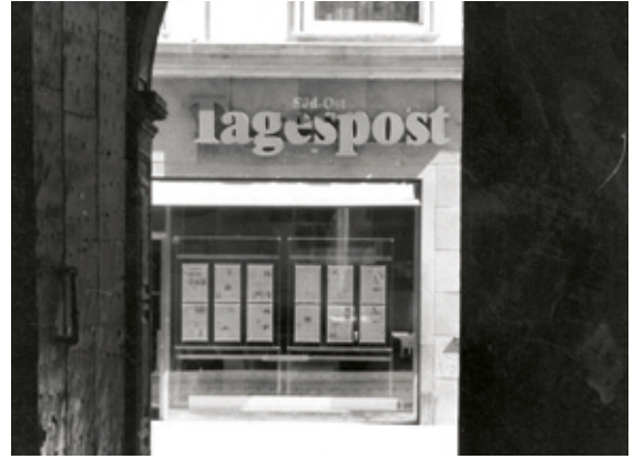
• Die traditionsreiche Tageszeitung „Südost Tagespost“ wird 1987 eingestellt.