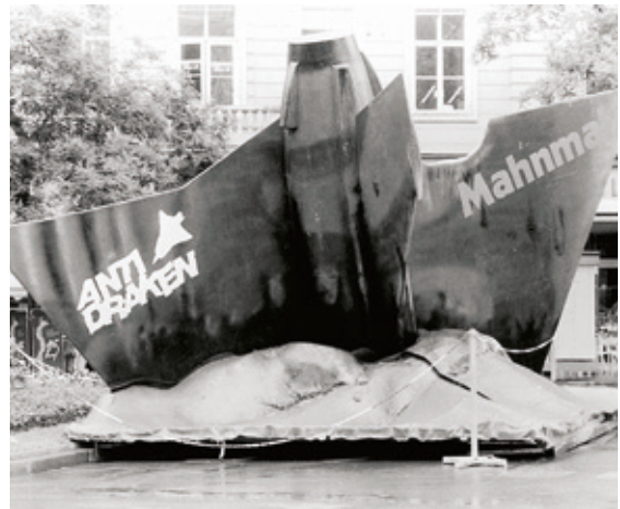
• Das „Anti-Draken-Mahnmal“ in Graz 1986.

ten der Steuerzahler – eingestellt. Es begann der mühsame Umbau der alten steirischen Industriegebiete zu neuen innovativen Zonen. In der Folge sollte sich insbesondere die Automobilindustrie mit ihren Zulieferern kräftig entwickeln.