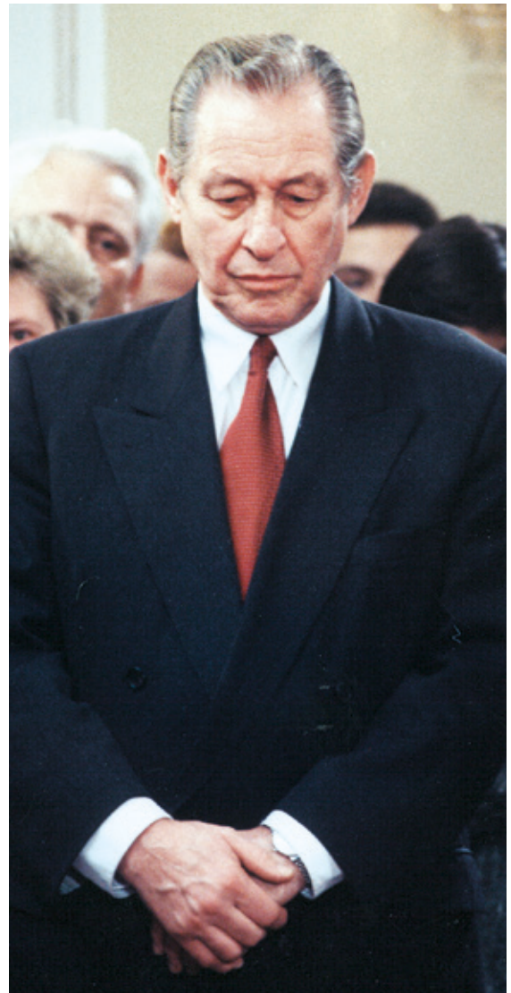
• Josef Krainer jun. tritt nach der Wahlniederlage am Wahlabend des 17. Dezember 1995 zurück.

1995 war in vielerlei Hinsicht ein denkwürdiges Jahr der 50er-Jubiläen: jeweils 50 Jahre nach dem Ende des Zweiten Weltkrieges, nach der Gründung der UNO, nach der Wiederbegründung der Zweiten Republik, nach der Gründung der Österreichischen und der Steirischen Volkspartei. Aber im Grunde wähten sich die Steirerinnen und Steirer sicher: Die Wirtschaft florierte, die Demokratie funktionierte, alles wurde immer besser. Es sollte noch einige Jahre dauern, bis ihnen eine große Wirtschaftskrise die Realität enthüllte. Freilich sollte auch sie die grundlegend zufriedene, wenn auch nörglerische Weltsicht der hiesigen Bewohnerinnen und Bewohner nicht verändern.