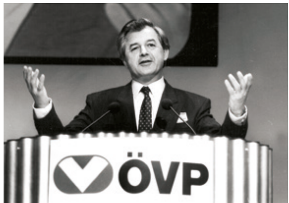
• Der Steirer Josef Riegler als ÖVP-Bundesparteiobmann im Jahr 1989.

Nationalratswahl im November wurden erstmals die Freiheitlichen und die Grünen quantitativ wirksam. Mit dem Eintritt der ÖVP in eine Regierungskoalition mit der SPÖ im Jänner 1987 komplizierte sich die politische Lage, man konnte nunmehr in der Steiermark nicht mehr einfach als regionale Opposition gegen die Bundesregierung auftreten. 1989 gingen für die ÖVP auch die Landtagswahlen in Kärnten, Salzburg und Tirol verloren. Auch die Steirische Volkspartei trat nun für die Ablöse des Bundesparteiobmannes Alois Mock ein, der ehemalige steirische Landesrat (mittlerweile Landwirtschaftsminister) Josef Riegler wurde Bundesparteiobmann, doch konnte er bei der Nationalratswahl 1990 die weitere deutliche Schwächung der ÖVP nicht verhindern. Die FPÖ gewann rund zehn Prozent. Es blieb bei der Großen Koalition. In der Auseinandersetzung von Erhard Busek und Bernhard Görg um die Parteiführung ging 1991 der Erstere als Sieger hervor.