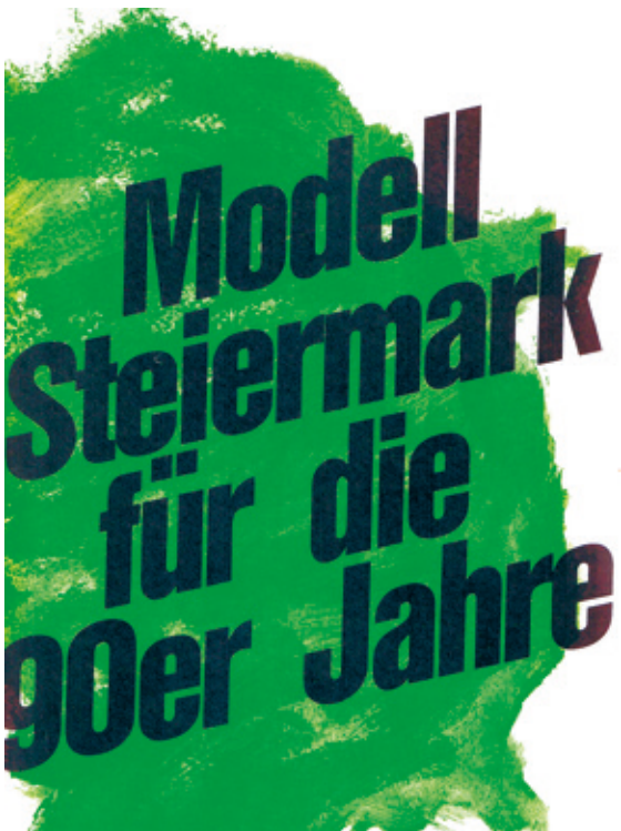
• Umschlag des „Modell Steiermark für die 90er Jahre“.

Die Steirische Volkspartei hat diese Veränderungen mit wachem Bewusstsein verfolgt. 1989 hat Außenminister Alois Mock in Brüssel die Aufnahme in die EU 7 beantragt; unter Bundeskanzler