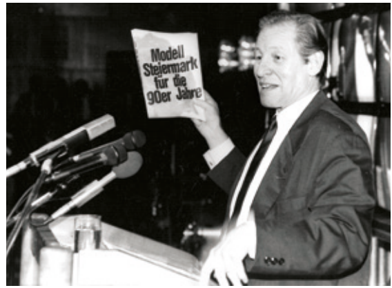
• Josef Krainer jun. präsentiert das „Modell Steiermark für die 90er Jahre“.

polizeilichen Untersuchungsprozesses verwickelt waren, mussten zurücktreten; beide wurde später rechtskräftig verurteilt, was in Österreich unter bestimmten Rahmenbedingungen keine weiteren Folgen zeitigt.