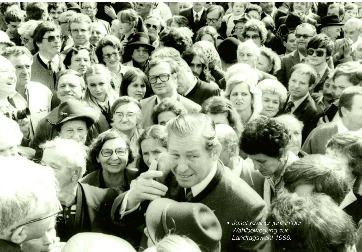
• Josef Krainer jun. in der Wahlbewegung zur Landtagswahl 1986.