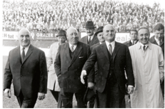
• Die Reformer Josef Klaus, Josef Krainer sen. und Franz Wegart in der legendären Grazer „Gruabn“.