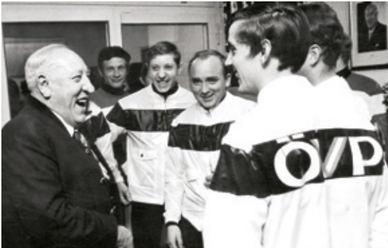
• Josef Krainer sen. mit jungen Wahlhelfern während des Landtagswahlkampfes 1970.