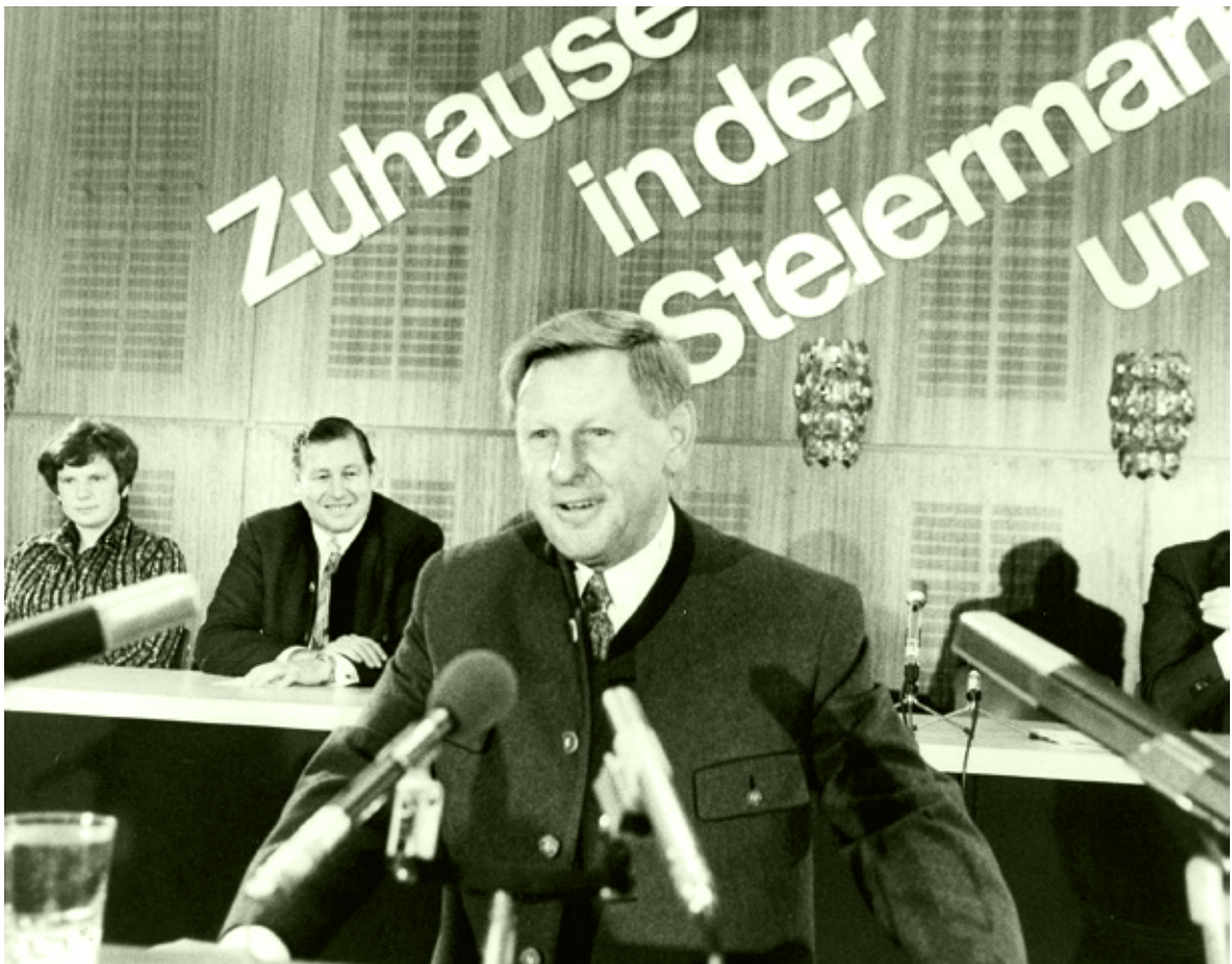
• Drei Landeshauptleute auf einem Bild: Waltraud Klasnic, Josef Krainer jun. sowie Friedrich Niederl am Pult.

aussetzung dafür geschaffen worden, dass die Landeshauptstadt Graz, Jahrzehnte später, 1999 zum UNESCO-Weltkulturerbe erklärt werden konnte.