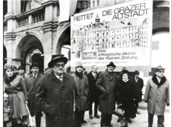
• Die Aktion „Rettet die Grazer Altstadt“ 1972.