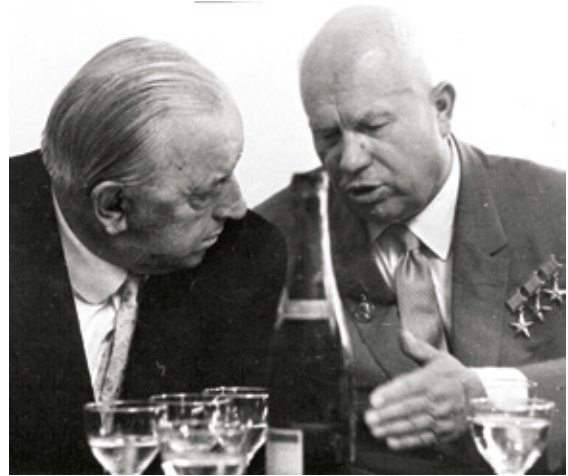
• Bundeskanzler Gorbach im Gespräch mit Nikita S. Chruschtschow, 1962.

Diskurses zu Themen der Zeit, beschäftigte sich in der Auftaktveranstaltung mit der Steiermark als einem „Land der Begegnungen“.