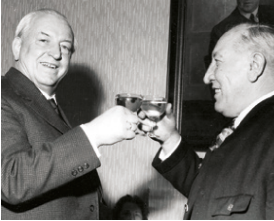
• Bundespolitik trifft Landespolitik. Bundeskanzler Alfons Gorbach und LH Josef Krainer sen.