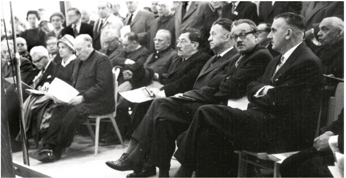
• Festakt zur Eröffnung des Forum Stadtpark 1960. In der ersten Reihe Josef Krainer sen. und Kulturlandesrat Hanns Koren (2. von rechts).

„Neuen Österreichischen Gesellschaft“ gefordert wurden. Die „Neue Österreichische Gesellschaft“ (unter Krainer und Außenminister Karl Gruber), die sogleich innerparteiliche Kritik auf sich zog, entpuppte sich dabei als erste große Reformbewegung innerhalb der ÖVP nach dem Krieg und verband drei Gruppen: den Österreichischen Gewerbeverein unter Rigobert Plass, den Akademikerbund unter Georg Zimmer-Lehmann und große Teile der Parteijugend. Primäres Ziel dieser Vereinigung war es, die ÖVP mit wirtschaftsliberalen und antibürokratischen Ideen wieder auf Erfolgskurs zu bringen und gleichzeitig das Gewicht der Länder innerhalb der Bundespartei zu stärken. So wurden ein modernes Wirtschaftsprogramm, ein klares Bekenntnis zum Föderalismus und eine effiziente Verwaltungsreform für den Staat postuliert. Außenpolitisch urgierte man – neben der Nachbarschaftspolitik – eine Annäherung an die EWG. Die „Neue Gesellschaft“, der u.a. auch Peter Reininghaus, Fritz Molden oder „Tagespost“-Chefredakteur Helmut Schuster angehörten, lebte später als „Ennstaler Kreis“ weiter, der von Alfred Rainer mitbegründet wurde. Auch wenn Krainer nie selbst Ambitionen zeigte, Bundeskanzler zu werden, so war es doch das durch die „Neue Österreichische Gesellschaft“ initiierte Moment der Erneuerung, das letztlich den Reformern in der ÖVP den Rücken stärken