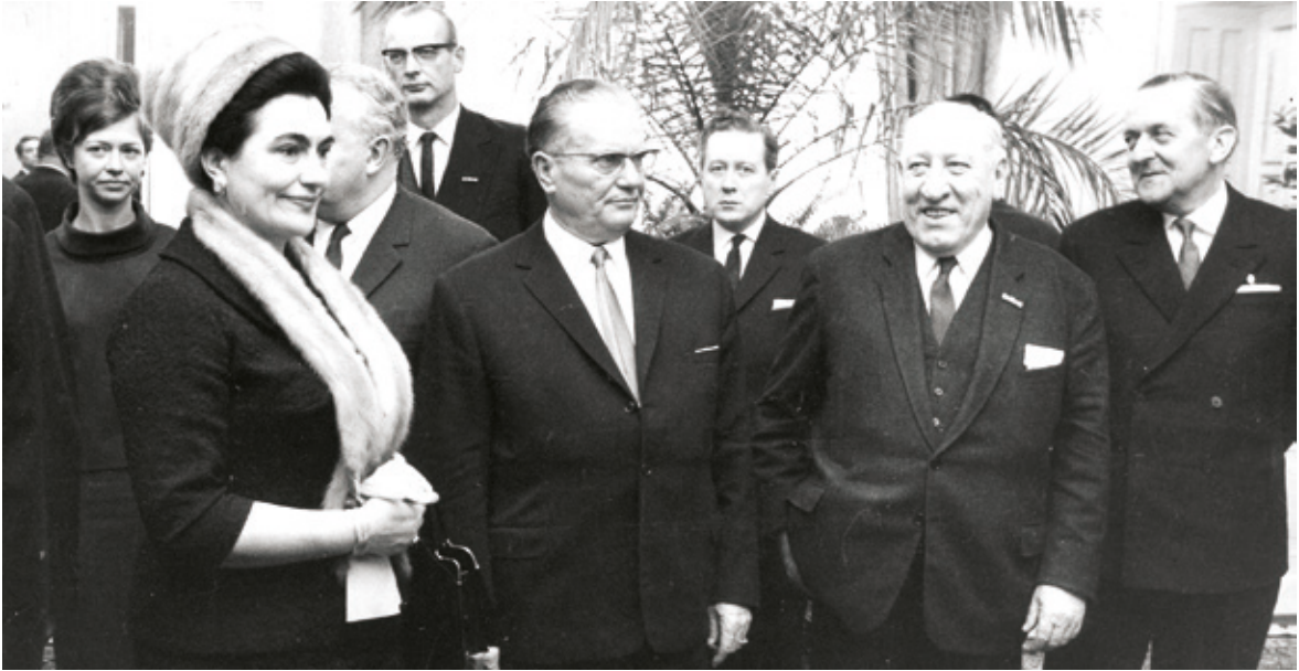
• Besuch des jugoslawischen Staatspräsidenten Josip Broz Tito 1967 in der Steiermark. Landeshauptmann Josef Krainer sen. forcierte eine regionale Nachbarschaftspolitik.

oder Flugblatt wurde allerdings nicht affiziert. Den besonders in der Steiermark spürbaren Nachteil Schärfs, zweimal aus der Katholischen Kirche ausgetreten zu sein, konnte die SPÖ in Gesprächen mit der Kirchenführung im Wesentlichen ausräumen. Die Annäherung von SPÖ und Katholischer Kirche war die Folge. Schärf gewann die Wahl knapp mit 51 % der Stimmen und wurde Bundespräsident.