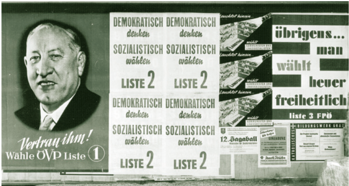
• Die erfolgreiche Personalisierung der ÖVP-Wahlwerbung. Plakatwand zur Landtagswahl 1961.

LH Krainer ginge, obwohl der Landeshauptmann unmittelbar überhaupt nicht gewählt wird. 9 Vorgetragen wurden die Argumente der Wahlkampflinie vom SPÖ-Vordenker Rupert Gmoser in der Parteizeitung „Neue Zeit“, der propagierte: „Allein der Sozialismus hat den Menschen eine Zukunft ohne Angst und ohne Hunger in Frieden und Freiheit zu bieten. Mit ihr wird eine Generation von Menschen erwachsen frei von Furcht und Not, in Wohlstand und Sicherheit, das eigene Geschick in demokratischer Selbstverantwortung formend.“ 10 Daneben warf die SPÖ Krainer vor, er hätte sich 1945 unter den Schutz der Tito-Partisanen gestellt, was dieser empört zurückwies.