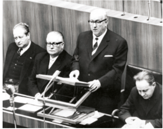
• Bundeskanzler Alfons Gorbach im österreichischen Parlament 1962.

deshauptmann, am 11. April 1961, aus gesundheitlichen Gründen und wegen der Wahlniederlage 1959 zurückgetreten war. Gorbach, der seit 1945 Landesparteiobmann der ÖVP in der Steiermark gewesen, jedoch nie Mitglied der Landesregierung geworden war, versuchte als Bundeskanzler den starren Zentralismus Raabs durch eine Aufwertung der Länderrechte und eine Stärkung des föderalen Elementes aufzulösen.