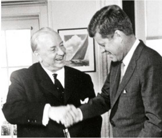
• Bundeskanzler Gorbach bei US-Präsident John F. Kennedy, 1962.