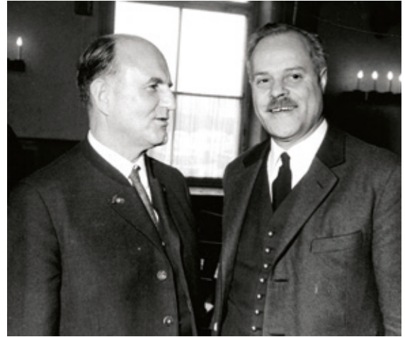
• Männer der Reform: Bundeskanzler Josef Klaus und Unterrichtsminister Theodor Piffl-Perčević.

1960 war Österreich – aus Neutralitätspolitischen Gründen – der European Free Trade Association (EFTA) beigetreten. Handelspartner der steirischen Wirtschaft sollten damit vor allem in Skandinavien gesucht werden. Die westdeutsche Wirtschaft, eine Säule der EWG, blieb dennoch der wichtigste Außenhandelspartner für die Steiermark. Das steirische Ziel blieb daher die Integration nach Westdeutschland und in die EWG.