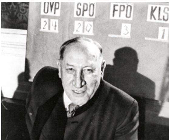
• Josef Krainer sen. freut sich über den Erfolg bei der Landtagswahl 1961.

nell konnte die ÖVP in den traditionellen Hochburgen der Sozialisten und den Arbeitervierteln gewinnen. 12 Csoklich: „In erfrischender Deutlichkeit zeigte sich vor allem, welchen entscheidenden Einfluß eine echte Persönlichkeit gerade heute im Zeitalter der anonymen Massen-Demokratie hat. [...] Die steirischen Wähler haben auch eine Antwort auf die so beliebt gewordene Koalitionsflunkerei gegeben: Sie gaben jenem Mann die Stimme, der die Schwächen der Koalition deutlich aufzeigte, um sie im Interesse einer echten Zusammenarbeit beseitigen zu können. In Graz gab die SPÖ die Parole aus: Galgen oder Zusammenarbeit. Das Ergebnis der Krainer-Wahl zeigt wie schief und unernst diese Alternative liegt. Der Österreicher will keinen Galgen. Er hat genug von Bürgerkriegsgeschrei und Parteienhaß. Er will Zusammenarbeit. [...] Es ist auch keine Frage, daß die vom Westen importierten neuartigen Wahlmethoden den Wahlausgang maßgeblich beeinflußt haben. [...] Die steirische Volkspartei hat mit diesen Methoden ihre Gegner überrollt. Vielleicht haben wir wirklich zu wenig getan, sagte in der Wahnacht ein sozialistischer Spitzenmandatar düster. Die Sozialistische Partei in der Steiermark ist durch den Wahlausgang in keine beneidenswerte Situation geraten. [...] Dr. Schachner-Blazizek meinte am Sonntag Abend, die Stimmenverluste der SPÖ an die KP bedeuteten eine Radikalisierung des politischen Klimas.“