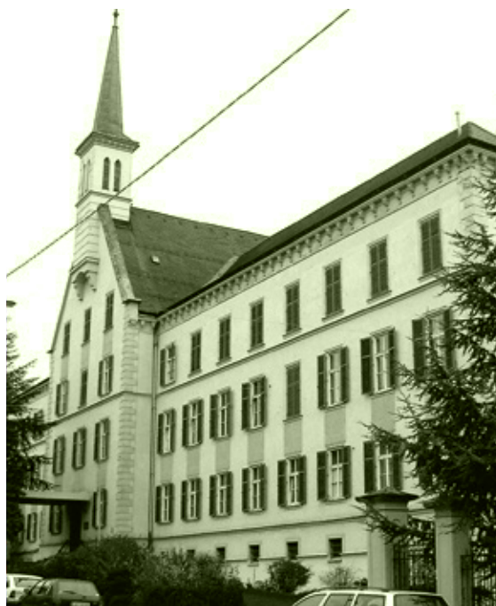
• Gegründet wurde die Volkspartei in der Steiermark im Konventsgebäude der Grazer Kreuzschwestern.