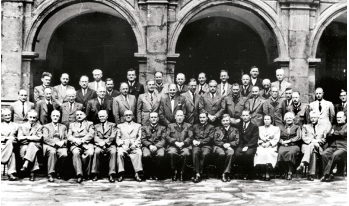
• Landesregierung und Mitglieder des Steiermärkischen Landtages 1948.