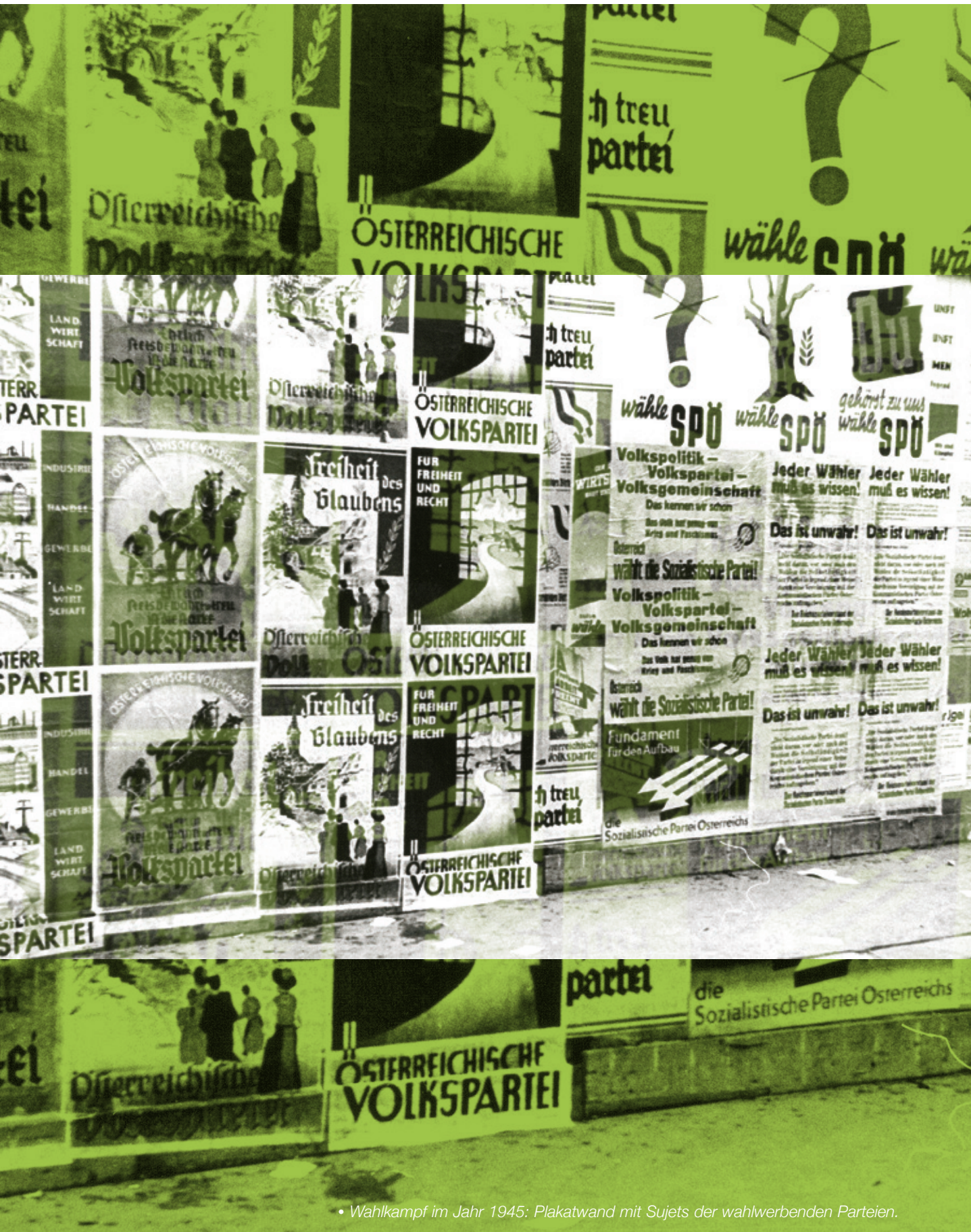
• Wahlkampf im Jahr 1945: Plakatwand mit Sujets der wahlwerbenden Parteien.